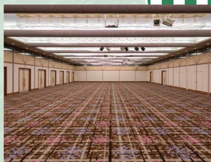
大會議廳「華陽之間」