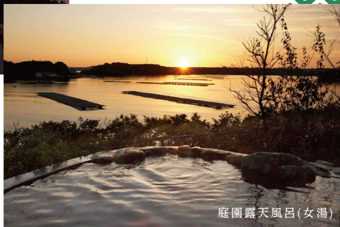
庭園露天風呂(女湯)

大浴場內有御影石風呂・木風呂・桑拿・水風呂,還有2個露天風呂。 (男女的浴池數相同)