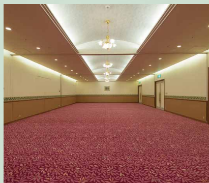
會議廳「マーガレット(Margaret)」