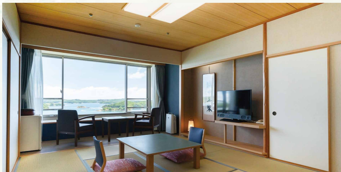
和室32㎡/可入住5人 燦陽棟4~6樓的客房於2021年4月翻新完畢。