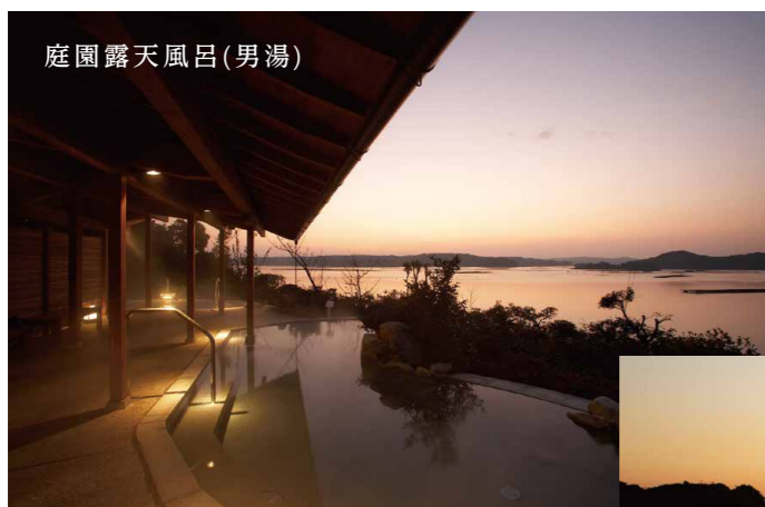
庭園露天風呂(男湯)

大浴場內有御影石風呂・木風呂・桑拿・水風呂,還有2個露天風呂。 (男女的浴池數相同)